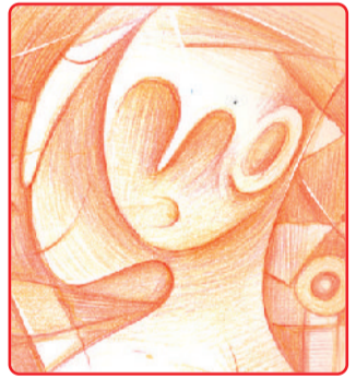
भाव श्रद्धा का न हो तो बंदगी किस काम की आस्था के नाम पर दीवानगी चलती नहीं सहना पड़ता है वमन का दर्द गुल के वारसे सिर्फ लफ़ाफ़ी से 'नवरंग' शायरी चलती नहीं

झूठ के बाजार में शाइस्तगी चलती नहीं वापसी होती है पर मुफ़ीसी चलती नहीं पेट की ख़ातिर ज़ालाना पड़ता खुद को रात-दिन इश्क करने से किसी की मिंदगी चलती नहीं वक़्त आ जाते बुरा तो आगे बढ़कर ग़ीसत में ज़ुन्नाना पड़ता है हरदम बुझदिली चलती नहीं लोग मिलते हैं जहाँ में खुद-परस्ती के लिए श्राजकल राते दफ़ान में दोस्ती चलती नहीं दूर जाना पड़ता है सबको श्रंकेते एक दिन आसमां चलता नहीं ये सरज़मीं चलती नहीं शौक से ज़लता है परवाना शमा के सामने बेखुदी के राल में श्रावारीं चलती नहीं रंग वो ही पालते हैं, गिनके बन में ख़ोटे हे हो खुलसो दिल अग्र तो डुरुकनी चलती नहीं