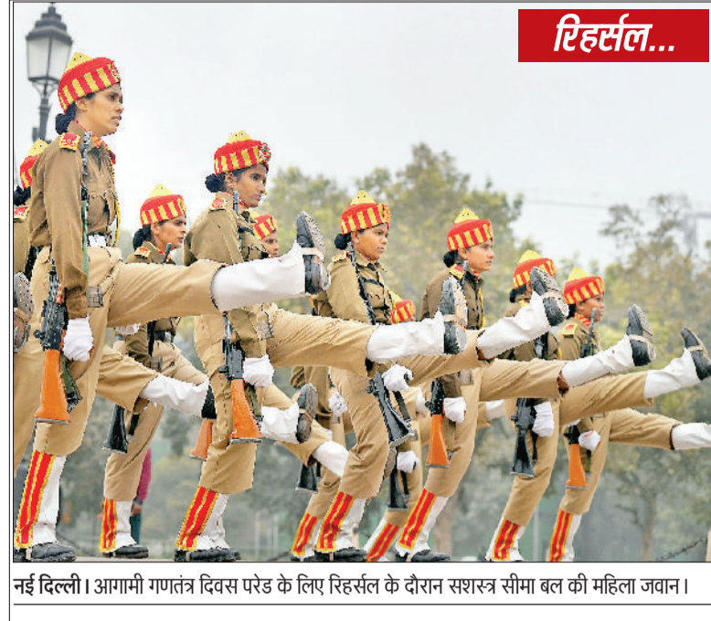
नई दिल्ली। आगामी गणतंत्र दिवस परेड के लिए रिहर्सल के दौरान सशस्त्र सीमा बल की महिला जवान।