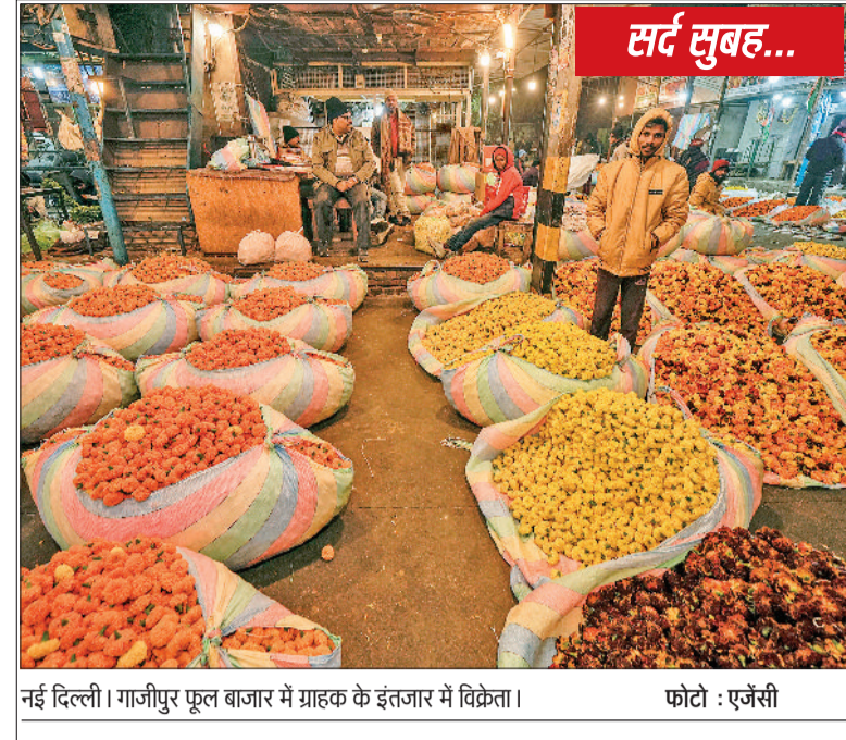
नई दिल्ली। गाजीपुर फूल बाजार में ग्राहक के इंतजार में विक्रेता।

वाहनों की गति मंद रही। पालम में सबसे ज्यादा कम दृश्यता देखी गई, यहां सुबह साढ़े पांच बजे दृश्यता 1000 मीटर थी। वहीं सफदरजंग में सुबह आठ बजे दृश्यता का स्तर 500 मीटर रहा। दूसरी तरफ अब भी दिल्ली की हवा में सुधार नहीं हुआ है। शनिवार को राजधानी की हवा की गुणवत्ता बहुत खराब श्रेणी में दर्ज की गई। पर्यावरण विभाग के अनुसार आनंद विहार में पीएम 2.5 का स्तर बहुत खराब श्रेणी 346 रहा। वहीं पीएम 10 का स्तर भी खराब श्रेणी में रहा।